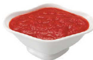
QUALITALY POLPAPIZZA POLPA DI POMODORO 24002W - MINIPACK 2x5KG