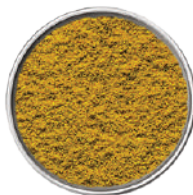
WIBERG CURRY POWDER MISCELA DI SPEZIE 560G 29048 - SCATOLA