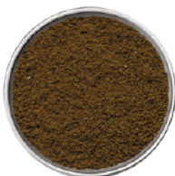
WIBERG SEMI DI CUMINO MACINATI 600G 29088 - SCATOLA