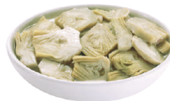
QUALITALY CARCIOFI A FETTINE AL NATURALE 2,5KG 30039 - LATTA