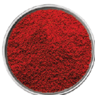
WIBERG PAPRICA PICCANTE 260G 29008A - SCATOLA