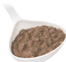
DEMETRA RAGÙ DI LEPRE 820G 22005 - LATTA