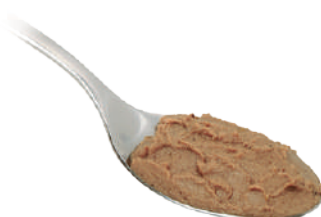
DEMETRA SALSA FEGATELLA 550G 25020 - VASO