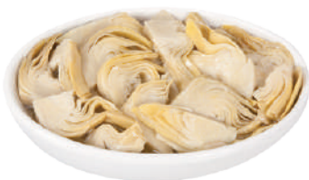
DEMETRA CARCIOFI A FETTINE PER PIZZA IN OLIO DI GIRASOLE 1,7KG 27086 - BUSTA