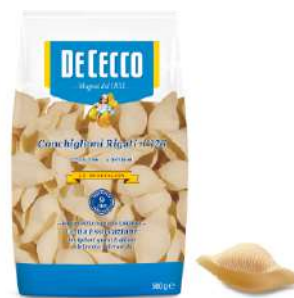
DE CECCO CONCHIGLIONI RIGATI N°126 500G 21201C - BUSTA