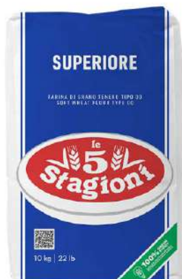
LE 5 STAGIONI FARINA SUPERIORE 25KG 33011 - SACCO (BLU)