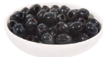
DEMETRA OLIVE NERE DENOCCIOLATE 2,5KG 27028 - LATTA