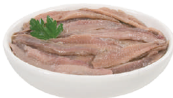
DEMETRA ACCIUGHE A FILETTI PRIMA SCELTA IN OLIO DI GIRASOLE 700G 28000B - BAULETTO