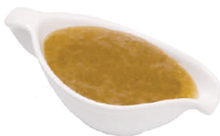
DEMETRA SALSA DI FICHI 450G 27083 - VASO