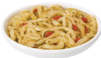
DEMETRA MELANZANE A FILETTI 1,53KG 27023 - VASO