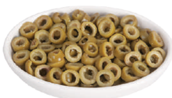
DEMETRA OLIVE VERDI A RONDELLE 2,5KG 27035A - LATTA