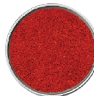
WIBERG PAPRICA AFFUMICATA 270G 29112 - SCATOLA