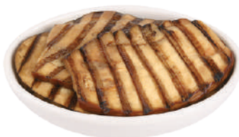
DEMETRA MELANZANE GRIGLIATE IN OLIO DI GIRASOLE 1,5KG 27053 - VASO