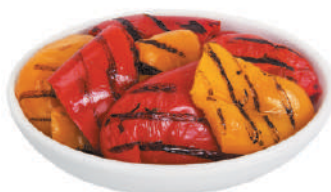
DEMETRA PEPERONI GRIGLIATI A PEZZETTONI 1,7KG 27037E - BUSTA