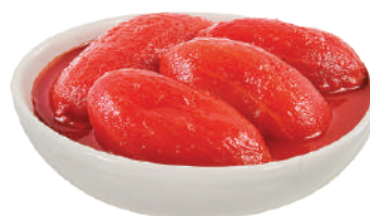
QUALITALY POMODORI PELATI 2,5KG 24002K - LATTA