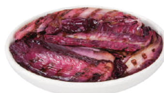
DEMETRA RADICCHIO GRIGLIATO 740G 27037A - SCATOLA