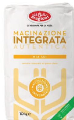
LE 5 STAGIONI FARINA MIA SEI 10KG 33010G - SACCO