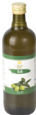
TAVOLA VIVA OLIO DI OLIVA 17007N - TANICA PET 5L 17007M - BOTTIGLIA 1L