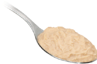
DEMETRA CREMA DI CIPOLLE 550G 25036 - VASO