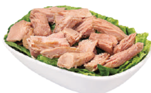
DEMETRA TONNO A PEZZI IN OLIO DI GIRASOLE 1KG 28002 - BUSTA