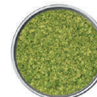
WIBERG PESCE SCANDIS SALE AROMATICO ERBE 700G 29080 - SCATOLA