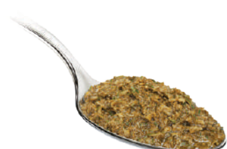
DEMETRA PESTO DI FINOCCHIETTO SELVATICO 510G 24038 - VASO