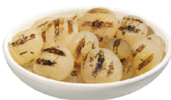
DEMETRA CIPOLLE GRIGLIATE 760G 27067 - LATTÀ