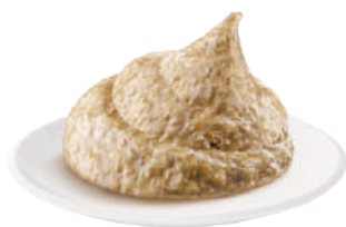
DEMETRA CREM-A-POCHE TARTUFATA CHIARA 600G 22011 - SAC-A-POCHE