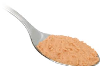
DEMETRA CREMA DI TONNO 570G 25013 - VASO