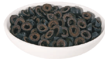
DEMETRA OLIVE NERE A RONDELLE 2,5KG 27029 - LATTA