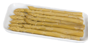
DEMETRA ASPARAGI VERDI TIPO RISTORAZIONE AL NATURALE 660G 27003A - BAULETTO