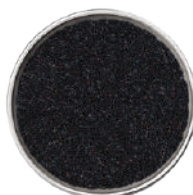
WIBERG SEMI DI SESAMO NERI INTERI 300G 29031 - SCATOLA