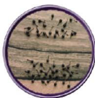
WIBERG PEPE DI VOATSIPERIFERY INTERO 240G 29113Q - SCATOLA