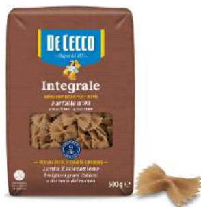
DE CECCO FARFALLE N°93 INTEGRALE 500G 21209A - BUSTA