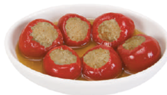
CANNONE PEPERONCINI RIPIENI TONNO E CAPPERI 2,8KG 23001D - VASO