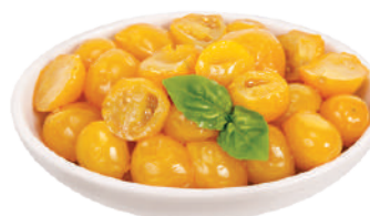
DEMETRA POMODORINI GIALLI MID-DRY IN OLIO DI GIRASOLE 750G 24017A - LATTA