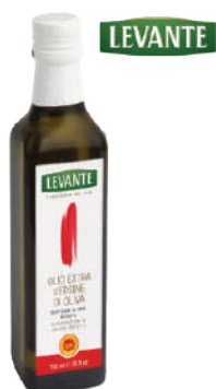
LEVANTE OLIO EXTRA VERGINE DI OLIVA DOP 500ML 17007D - BOTTIGLIA