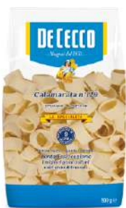
DE CECCO CALAMARATA N°129 500G 21217 - BUSTA