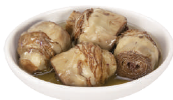
DEMETRA CARCIOFI RUSTICI IN OLIO DI GIRASOLE 770G 27008 - LATTA