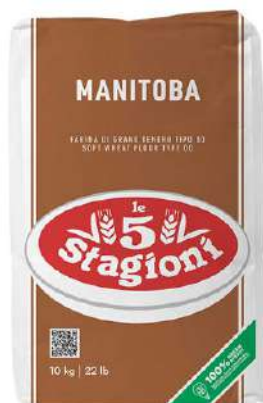
LE 5 STAGIONI FARINA MANITOBA 25KG 33007 - SACCO (MARRONE)