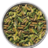
WIBERG SEMI DI FINOCCHIO INTERI 390G 29044 - SCATOLA