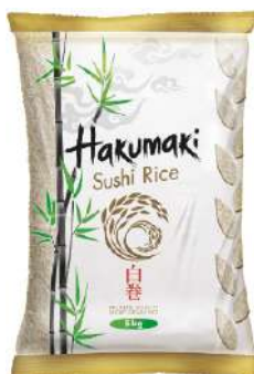
SCOTTI RISO PER SUSHI HAKUMAKI 5KG 21504B - SACCO