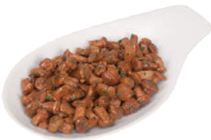
DEMETRA GALLINACCI TRIFOLATI PICCOLI 600G 27049 - BUSTA