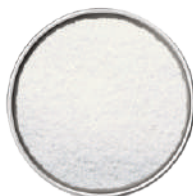
WIBERG PREPARATO PER LA STABILIZZAZIONE DEL COLORE, BIANCO 400G 291131 - SCATOLA