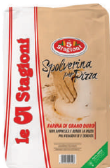
LE 5 STAGIONI SPOLVERINA 10KG 33012A - SACCO