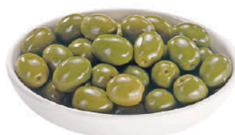
QUALITALY OLIVE VERDI INTERE IN SALAMOIA 4KG 30043A - LATTA