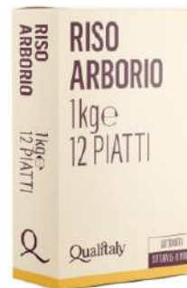
QUALITALY RISO PARBOLEID 21501 - SCATOLA 1KG