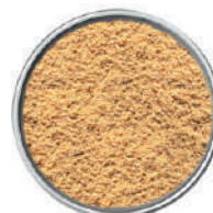
WIBERG ZENZERO MACINATO 470G 29084 - SCATOLA