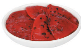
DEMETRA PEPERONI PIQUILLO ARROSTITI 660G 27037F - BAULETTO