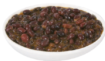
DEMETRA FAGIOLI MEXICANOS 900G 27020 - LATTÀ