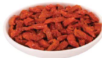
QUALITALY POMODORI SECCHI IN OLIO DI GIRASOLE 2,9KG 30033 - VASO