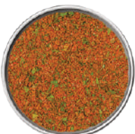
WIBERG MARINATA PER GRIGLIATE MISCELA DI SPEZIE 520G 29050A - SCATOLA