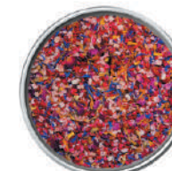
WIBERG MIX DI FRUTTI DECORAZIONI - CON PETALI 50G 29111 - SCATOLA