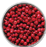
WIBERG PEPE ROSA ESSICCATO IN GRANI 160G 29010 - SCATOLA