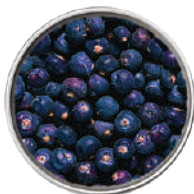
WIBERG BACCHE DI GINEPRO IN GRANI 400G 26026 - SCATOLA