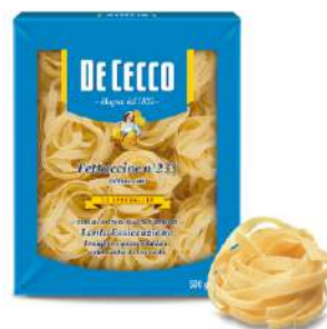
DE CECCO FETTUCINE N°233 500G 21202A - BUSTA