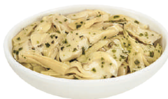
DEMETRA CARCIOFI A FETTINE TRIFOLATI IN OLIO DI GIRASOLE 1,7KG 27007 - BUSTA