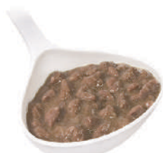
QUALITALY RAGÙ DI LEPRE 820G 22000E - LATTA