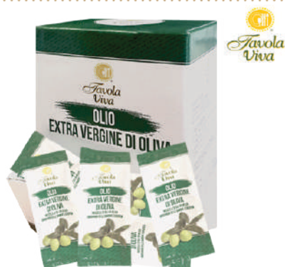
TAVOLA VIVA OLIO EXTRA VERGINE DI OLIVA BUSTINE MONODOSE 100PZx10ML 17019C - PACK MONO