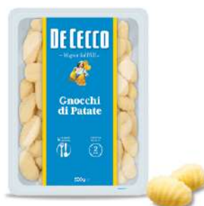
DE CECCO GNOCCHI DI PATATE 500G 21202F - BUSTA