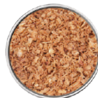
WIBERG CIPOLLE ARROSTITE TRITATE 1KG 29073 - SACCO