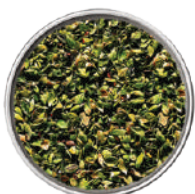
WIBERG ORIGANO ESSICCATO 29005 - SCATOLA 90G 29005A - VASCHETTA 430G