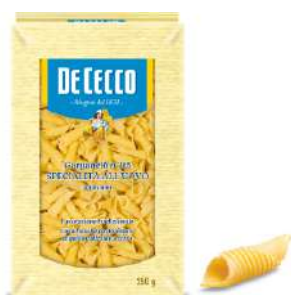
DE CECCO GARGANELLI N°115 ALL'UOVO 250G 21202Y - BUSTA