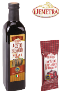
DEMETRA ACETO BALSAMICO DI MODENA IGP 17003 - BOTTIGLIA 500ML 17004 - PACK MONO 300x5ML