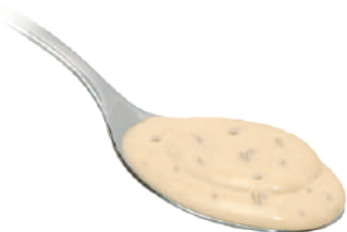
DEMETRA CREMA AI CINQUE FORMAGGI 540G 25041A - VASO