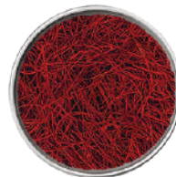
WIBERG FILI DI PEPERONCINO SOTTILI 45G 29007 - SCATOLA