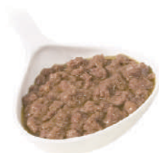
QUALITALY RAGÙ DI CERVO 820G 22000C - LATTA