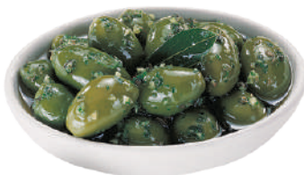
DEMETRA OLIVE VERDI GIGANTI AROMATIZZATE 2,5KG 27035B - LATTA