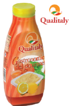
QUALITALY MAIONESE 950G 30007I - SQUEEZE