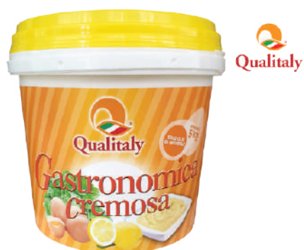
QUALITALY MAIONESE GASTRONOMICA CREMOSA 5KG 30004 - SECCHIO