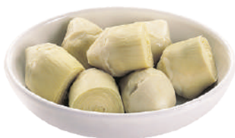
QUALITALY CARCIOFI INTERI MEDI IN OLIO DI GIRASOLE 2,9KG 30048 - VASO