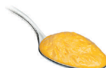
DEMETRA CREMA DI ZAFFERANO 530G 27022C - VASO