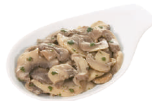
DEMETRA CHAMPIGNONS TRIFOLATI DAL FRESCO 1,7KG 23047 - BUSTA