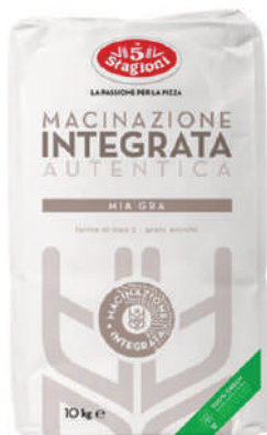
LE 5 STAGIONI FARINA MIA GRA 10KG 33010F - SACCO