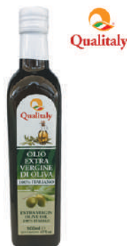
QUALITALY OLIO EXTRA VERGINE DI OLIVA 17007I - BOTTIGLIA 500ML 17007L - BOTTIGLIA 250ML