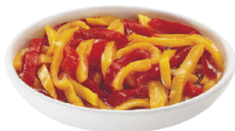
DEMETRA PEPERONI A FILETTI 27037C - BUSTA 700G 27037 - VASO 1,6KG