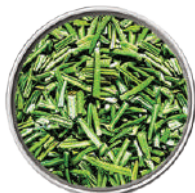
WIBERG ROSMARINO LIOFILIZZATO 140G 29040 - SCATOLA