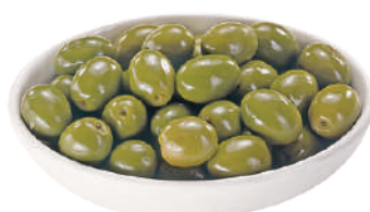
DEMETRA OLIVE VERDI COCKTAIL 2,5KG 27034 - LATTA