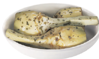
QUALITALY CARCIOFI ALLA ROMANA CON GAMBO IN OLIO DI GIRASOLE 2,5KG 30032 - LATTA