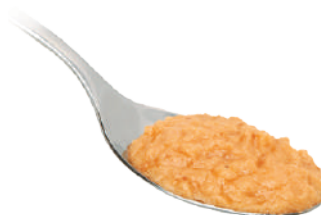
DEMETRA CREMA DI SALMONE 550G 25011 - VASO