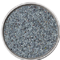
WIBERG SEMI DI PAPAVERO INTERI 700G 29045 - SCATOLA