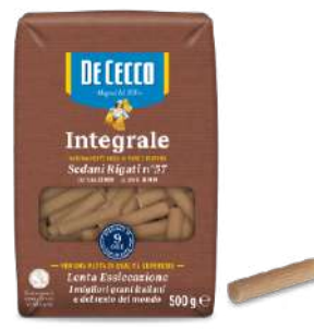
DE CECCO SEDANI RIGATI N°57 INTEGRALE 500G 21217A - BUSTA