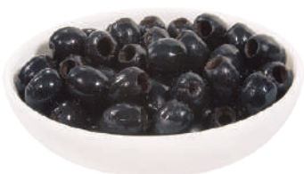
QUALITALY OLIVE NERE DENOCCIOLATE 4KG 30042 - LATTA