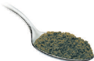
DEMETRA CREMA DI ORTICA 540G 25008 - VASO