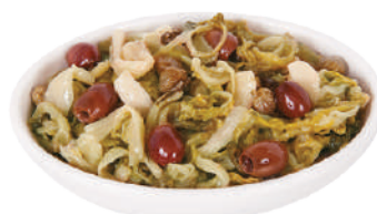
DEMETRA SCAROLA BRASATA 520G 27046 - VASO