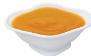
DEMETRA VELLUTATA DI DATTERINI GIALLI 800G 30021A - LATTA