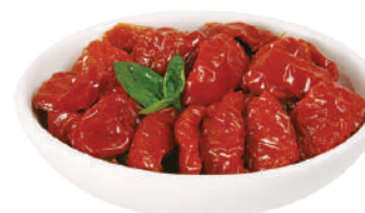
DEMETRA POMODORINI A PEZZI MID-DRY IN OLIO DI GIRASOLE 780G 24006 - LATTA