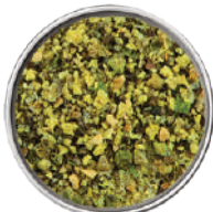
WIBERG PEPE AL LIMONE 750G 29113F - SCATOLA