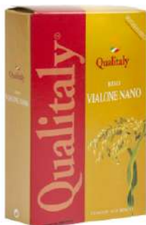
QUALITALY RISO VIALONE NANO 1KG 21504A - SCATOLA