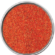
WIBERG PATATINE FRITTE SALE AROMATICO 1,15KG 29091 - SCATOLA