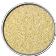
WIBERG SEMI DI SESAMO SGUSCIATI INTERI 290G 29046 - SCATOLA