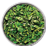
WIBERG ERBE DELLA PROVENZA LIOFILIZZATE 100G 29113C - SCATOLA