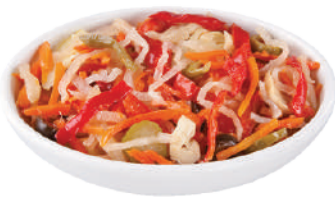
DEMETRA FANTASIA DI VERDURE 1,8KG 27076 - BUSTA