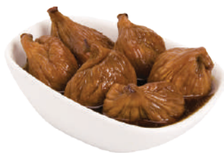
DEMETRA FICHI AL MARASCHINO 650G 27048 - VASO