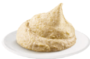
DEMETRA CREM-A-POCHE CARCIOFI 600G 22009 - SAC-A-POCHE