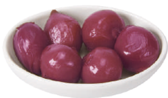
DEMETRA CIPOLLE ROSSE IN ACETO DI VINO 1,6KG 27016 - VASO