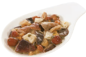
DEMETRA MISTO FUNGHI TRIFOLATI C'ERA UNA VOLTA 700G 23012 - BUSTA