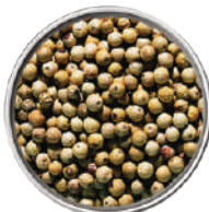
WIBERG PEPE BIANCO IN GRANI 735G 29094 - SCATOLA