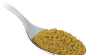
DEMETRA CREMA DI OLIVE VERDI 550G 25007 - VASO