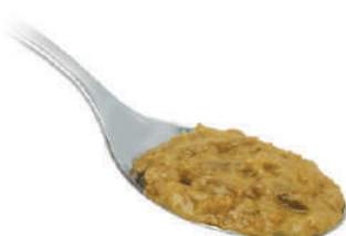
QUALITALY CREMA DI ASPARAGI 580G 30027 - VASO