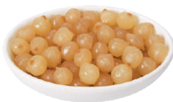
DEMETRA CIPOLLINE COCKTAIL IN ACETO DI VINO ROSÈ 1,6KG 27017 - VASO