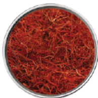
WIBERG FILI DI ZAFFERANO QUALITÀ ECCELLENTE 4x1G 29113E - BLISTER