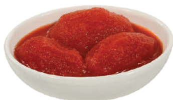
DEMETRA POMODORI PELATI INTERI 2,5KG 24004 - LATTA