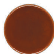
WIBERG SALSA WOK TERIYAKI 800G 29113R - SQUEEZER