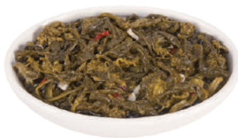
DEMETRA FRIARIELLI 27021 - VASO 530G 27021A - VASO 1,5KG