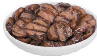
DEMETRA MELANZANE GRIGLIATE A RONDELLE 27025 - BUSTA 1,7KG 27025B - VASO 1,7KG