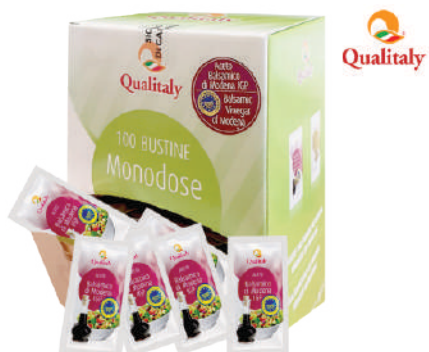
QUALITALY ACETO BALSAMICO DI MODENA IGP BUSTINE MONODOSE 100PZx5ML 17019D - PACK MONO