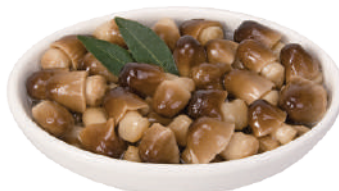
DEMETRA FUNGHI DI MUSCHIO IN OLIO DI GIRASOLE 1,6KG 23009 - VASO