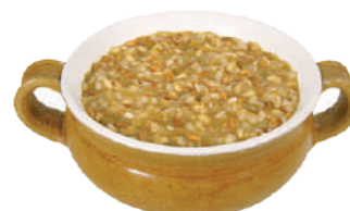
DEMETRA ZUPPA DI ORZO E CEREALI 880G 29069 - LATTA