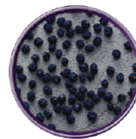
WIBERG PEPE DI MONTAGNA DELLA TASMANIA 200G 29113A - SCATOLA