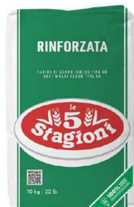
LE 5 STAGIONI FARINA RINFORZATA 25KG 33010 - SACCO (VERDE)