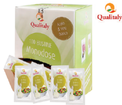
QUALITALY ACETO DI VINO BIANCO BUSTINE MONODOSE 100PZx5ML 17019E - PACK MONO