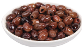
DEMETRA OLIVE TAGGIASCHE DENOCCIOLATE IN OLIO EXTRAVERGINE OLIVA 750G 27030A - LATTA