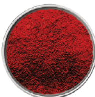
WIBERG PAPRICA RUBINO DELICATA 630G 29008 - SCATOLA