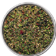
WIBERG GRILL-BARBECUE SALE AROMATICO 910G 29049 - SCATOLA