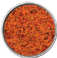
WIBERG BURGER MIX SPICY 760G 29086 - SCATOLA