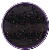
WIBERG BLACK BBQ - MISCELA DI SPEZIE BARBACOA 340G 29061 - SCATOLA