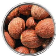
WIBERG NOCE MOSCATA INTERA 300G 29029 - SCATOLA