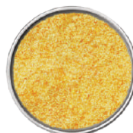
WIBERG BRODO DI POLLO 1,1KG 29038B - SCATOLA