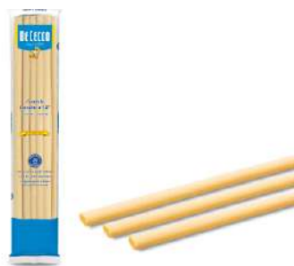
DE CECCO CANDELE LUNGHE N°127 500G 21201B - BUSTA