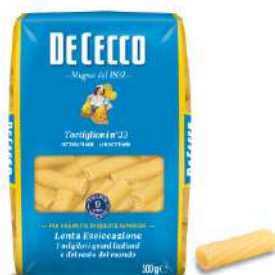
DE CECCO TORTIGLIONI N°23 FOOD SERVICE 1KG 21212 - BUSTA