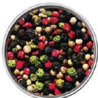
WIBERG PEPE ARLECCHINO IN GRANI 550G 29030 - SCATOLA