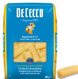
DE CECCO RIGATONI N°24 FOOD SERVICE 1KG 21211 - BUSTA