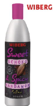
WIBERG SWEET & SPICY CIOCCOLATO E CARDAMOMO 580ML 29515D - BOTTIGLIA