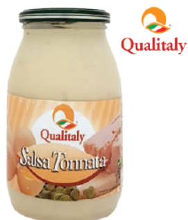
QUALITALY SALSA TONNATA 960G 30005 - VASO