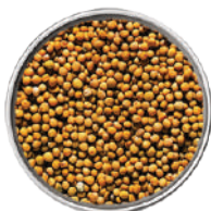
WIBERG SEMI DI SENAPE IN GRANI 380G 29075 - SCATOLA