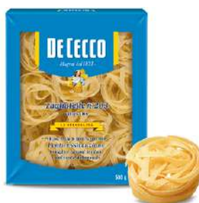
DE CECCO TAGLIATELLE N°203 500G 21202B - BUSTA