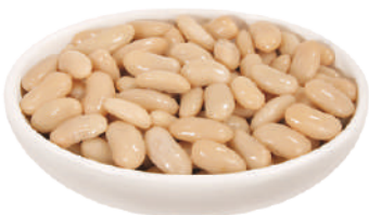
DEMETRA FAGIOLI CANNELLINI LESSATI 2,5KG 27019 - LATTA