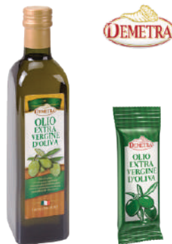
DEMETRA OLIO EXTRA VERGINE DI OLIVA 25029 - BOTTIGLIA 500ML 17005 - PACK MONO 300x10ML