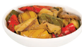
DEMETRA VERDURE MISTE GRIGLIATE 1,7KG 27039 - BUSTA