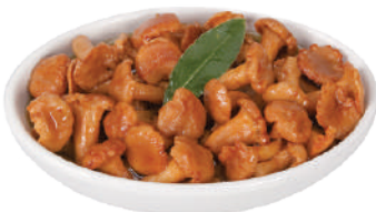
DEMETRA GALLINACCI IN OLIO DI OLIVA 800G 23011 - LATTA