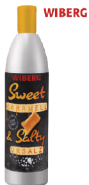
WIBERG SWEET & SALTY CARAMELLO E SALGEMMA 580ML 29515C - BOTTIGLIA