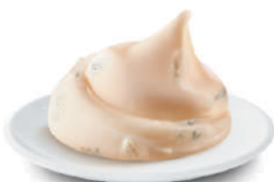
DEMETRA CREM-A-POCHE AL GORGONZOLA DOP 22012B - SAC-A-POCHE