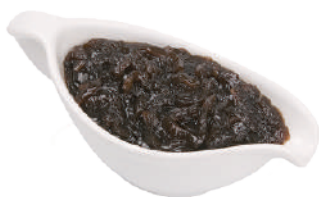
DEMETRA SALSA DI CIPOLLE 430G 25017 - VASO