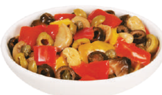
DEMETRA VERDURE ALLA ZINGARA IN OLIO DI GIRASOLE 1,7KG 27038 - BUSTA