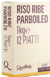
QUALITALY RISO PARBOLEID 21503 - SCATOLA 1KG