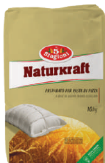
LE 5 STAGIONI NATURKRAFT PIZZA 33016A - SACCO 10KG 33016 - BUSTA 500G