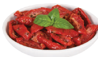
DEMETRA POMODORINI TUTTOSOLE MID-DRY IN OLIO DI GIRASOLE 780G 24017 - LATTA