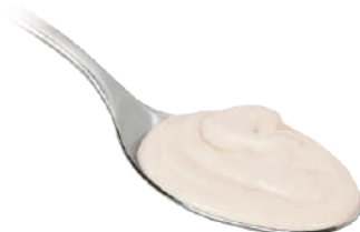
DEMETRA CREMA DI FORMAGGIO AL PECORINO 550G 25008A - VASO