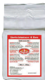
LE 5 STAGIONI LIEVITO ISTANTANEO 500G 33013 - SACCHETTO