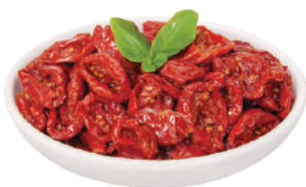
DEMETRA POMODORI CILIEGINI SECCHI IN OLIO DI GIRASOLE 700G 24020V - BUSTA