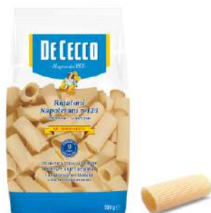
DE CECCO RIGATONI NAPOLETANI N°124 500G 21202 - BUSTA