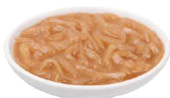
DEMETRA CIPOLLE A FETTE CARAMELLATE 700G 25043 - BUSTA