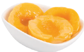
QUALITY PESCHE A METÀ ALLO SCIROPPO 2,65KG 24003D - LATTA