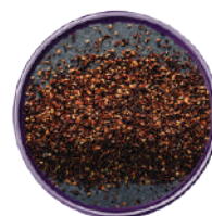
WIBERG PEPE - CUVEE MISCELA DI SPEZIE TRITATE 240G 29039 - SCATOLA