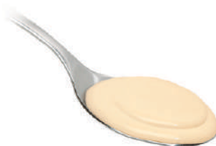
QUALITALY CREMA AL FORMAGGIO 580G 30029 - VASO