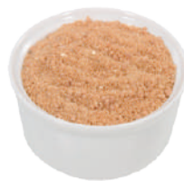
DEMETRA PREPARATO PER BRODO DI PESCE GRANULARE 800G 26003 - BARATTOLO