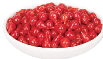
DEMETRA PEPERONCINI GOCCE ROSSE IN AGRODOLCE 793G 29119 - VASO