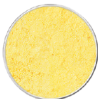
WIBERG MAGO PANATA PANATURA SENZA PANGRATTATO 2KG 29078 - SECCHIELLO