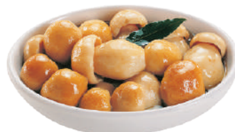
DEMETRA PORCINI INTERI IN OLIO DI OLIVA 800G 23015A - LATTA