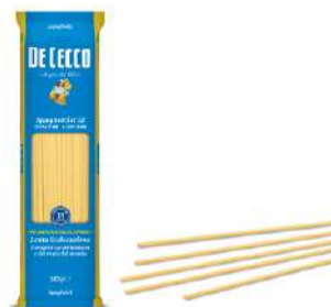
DE CECCO SPAGHETTI N°12 FOOD SERVICE 1KG 21214 - BUSTA