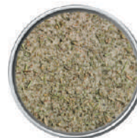
WIBERG ARROSTO DELIZIA SALE AROMATICO 950G 29015 - SCATOLA