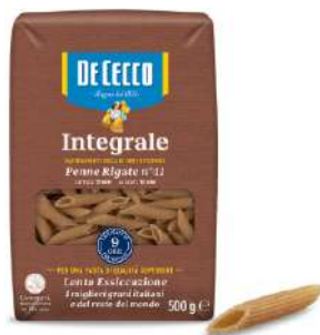
DE CECCO PENNE RIGATE N°41 INTEGRALE 500G 21202L - BUSTA