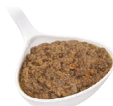
DEMETRA RAGÙ DI SEITAN 700G 29118A - BUSTA