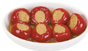
DEMETRA PEPERONCINI FARCITI TONNO / CAPPERI / ACCIUGHE 1,55KG 27036 - VASO