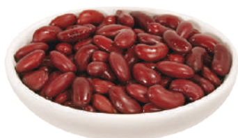
DEMETRA FAGIOLI RED KIDNEY LESSATI 2,5KG 27062 - LATTA