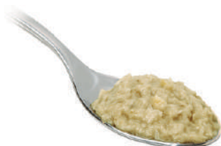
QUALITALY CREMA DI CARCIOFI 580G 30028 - VASO