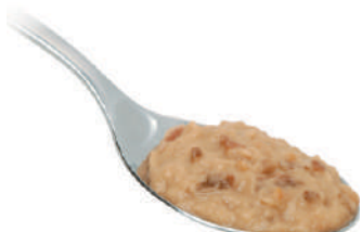
DEMETRA CREMA DI MELANZANE 550G 25005 - VASO