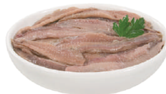
DEMETRA ACCIUGHE A FILETTI IN OLIO DI OLIVA 700G 28000 - BAULETTO