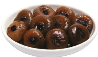
DEMETRA CIPOLLE BUONGUSTO 850G 27072 - LATTÀ