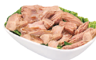
QUALITALY TONNO IN OLIO DI OLIVA 290971 - SCATOLA 80Gx3 290970 - BUSTA 1,73KG