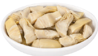
DEMETRA CARCIOFI A SPICCHI PER PIZZA IN OLIO DI GIRASOLE 1,7KG 27011 - BUSTA