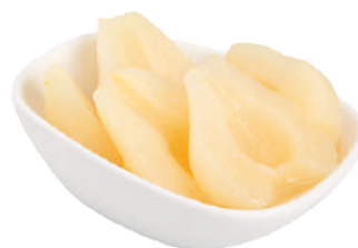
QUALITY PERE A METÀ ALLO SCIROPPO 2,65KG 24003B - LATTA