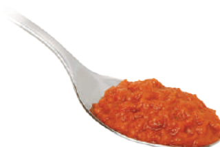
DEMETRA CREMA PICCANTE MEDITERRANEA 550G 25015 - VASO