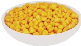
QUALITALY MAIS DOLCE SOTTOVUOTO 2,1KG 24003C - LATTA