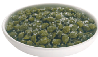
DEMETRA CAPPERI AL SALE 1KG 27004 - SCATOLA PET