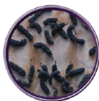
WIBERG PEPE LUNGO DELL'ASSAM INTERO 200G 29113B - SCATOLA