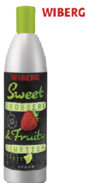
WIBERG SWEET & FRUIT FRAGOLA E LIME 633ML 29515B - BOTTIGLIA