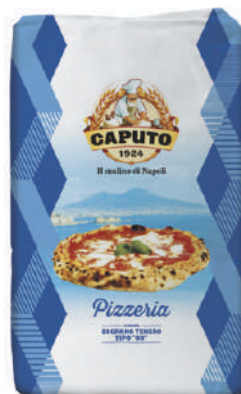
CAPUTO BLU 00 PIZZERIA 25KG 33032F - SACCO