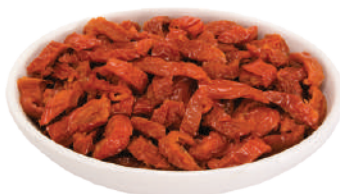
DEMETRA POMODORI SECCHI A FILETTI IN OLIO DI GIRASOLE 1,5KG 24005B - BUSTA