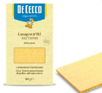
DE CECCO LASAGNE N°112 ALL'UOVO 500G 21202N - BUSTA