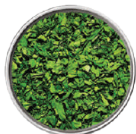
WIBERG PREZZEMOLO LIOFILIZZATO 50G 29071A - SCATOLA