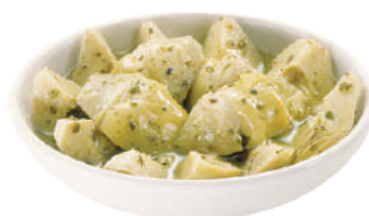
DEMETRA CARCIOFI A SPICCHI TRIFOLATI 1,7KG 27007A - BUSTA