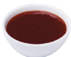
WIBERG DIP-SAUCE BARBECUE 850G 29083 - SQUEEZER