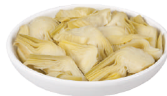
QUALITALY CARCIOFI A FETTINE TRIFOLATI IN OLIO DI GIRASOLE 2,5KG 30036 - LATTA