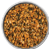
WIBERG PEPE ALL'ARANCIO 770G 29039O - SCATOLA