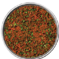
WIBERG GRILL-MEXIKANA STYLE SALE AROMATICO 750G 29077A - SCATOLA