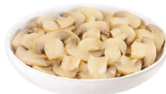
DEMETRA CHAMPIGNONS AFFETTATI DAL FRESCO 23018 - BUSTA 1,7KG 23018A - LATTA 2,5KG