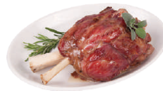
DEMETRA STINCO DI SUINO PRECOTTO 650G 23044 - BUSTA