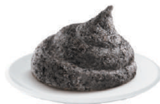
DEMETRA CREM-A-POCHE TARTUFATA TOSCANA 600G 22011B - SAC-A-POCHE