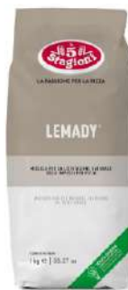
LE 5 STAGIONI LEMADY LIEVITO 1KG 33010H - SACCHETTO