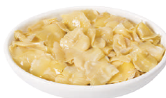
QUALITALY FOGLIE DI CARCIOFO 2,9KG 30038 - VASO