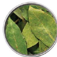
WIBERG FOGLIE D'ALLORO INTERE 60G 29093 - SCATOLA