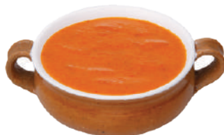
DEMETRA GAZPACHO 820G 28005A - LATTA