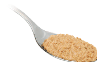
DEMETRA SALSA DI NOCI 530G 25018 - VASO