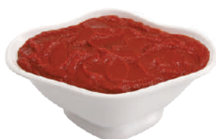
DEMETRA DOPPIO CONCENTRATO DI POMODORO 800G 24003 - LATTA