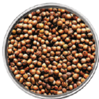
WIBERG CORIANDOLO IN GRANI 160G 29006G - SCATOLA