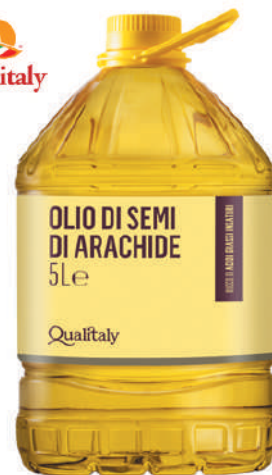
QUALITALY OLIO DI SEMI DI ARACHIDE 5L 17007E - TANICA PET