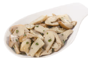
DEMETRA FUNGHI TRIFOLATI PORCINETTI 700G 23010A - BUSTA