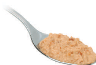
DEMETRA CREMA DI PORCINI 540G 25010 - VASO