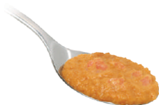
DEMETRA CREMA DI GAMBERETTI 540G 25004 - VASO