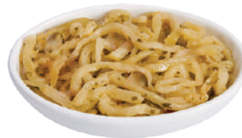
CANNONE MELANZANE A FILETTI ALLA PUGLIESE 2,9KG 23001C - VASO