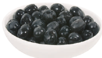
DEMETRA OLIVE NERE COCKTAIL PICCOLE 2,5KG 27027 - LATTA