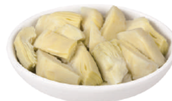
DEMETRA CARCIOFI A SPICCHI PER PIZZA PRIMA SCELTA 1,5KG 27010 - BUSTA