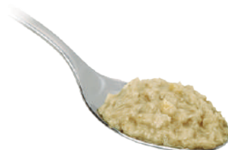
DEMETRA CREMA DI CARCIOFI 540G 25003 - VASO