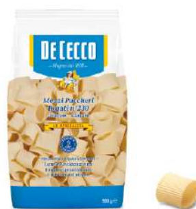
DE CECCO MEZZI PACCHERI RIGATI N°230 500G 21201E - BUSTA