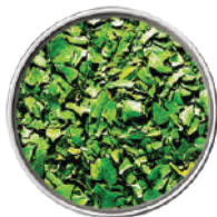
WIBERG BASILICO LIOFILIZZATO 55G 29518 - SCATOLA