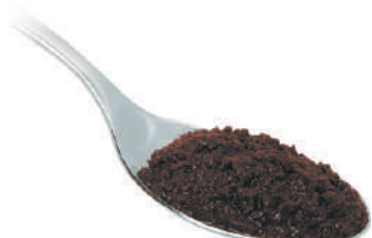
DEMETRA CREMA DI OLIVE NERE 550G 25006 - VASO