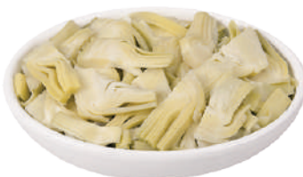
DEMETRA CARCIOFI A FETTINE PER PIZZA PRIMA SCELTA 1,5KG 27006 - BUSTA