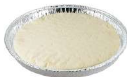
GRECI BASE PIZZA SENZA GLUTINE E SENZA LATTOSIO 240G (CON TEGLIA) 33015P - PZ (FRESCO)