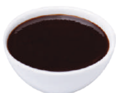
WIBERG DIP-SAUCE SMOKED HONEY 850G 29070 - SQUEEZER