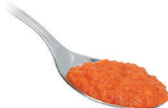
DEMETRA CREMA DI PEPERONI 550G 25009 - VASO