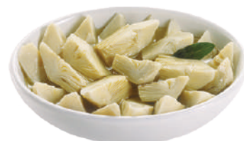
QUALITALY CARCIOFI A SPICCHI IN OLIO DI GIRASOLE 2,5KG 30034 - LATTA