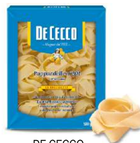
DE CECCO PAPPARDELLE N°201 500G 21202T - BUSTA