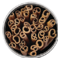
WIBERG CANNELLA BASTONCINI 400G 29027 - SCATOLA