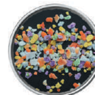
WIBERG FIOR DI SALE COLORATO E SPEZIE 450G 29008I - SCATOLA