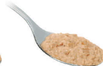
DEMETRA CREMA DI PORCINI AL TARTUFO 540G 25010A - VASO