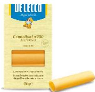
DE CECCO CANNELLONI N°100 ALL'UOVO 250G 21519A - BUSTA