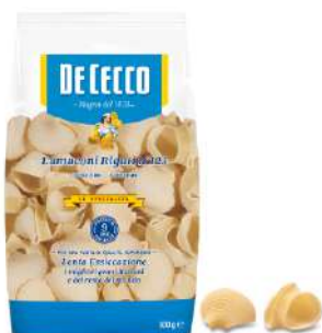
DE CECCO LUMACONI RIGATI N°123 500G 21201D - BUSTA