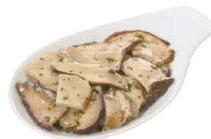
DEMETRA PORCINI TRIFOLATI A FETTE C'ERA UNA VOLTA 700G 23014 - BUSTA