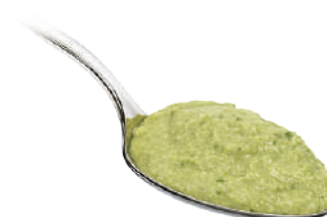
DEMETRA SALSA GUACAMOLE 550G 29114 - VASO