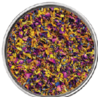
WIBERG MIX DI PETALI PER DECORAZIONI MISCELA DI FIORI 25G 29017 - SCATOLA