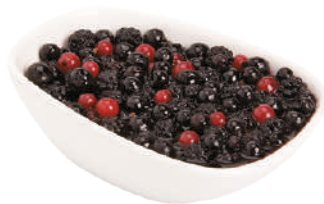
DEMETRA MIX-NOIR FRUTTI DI BOSCO INTERI 620G 29001 - VASO