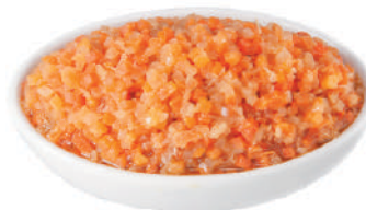
DEMETRA SOFFRITTO PRONTO ALL'USO 530G 27022E - VASO