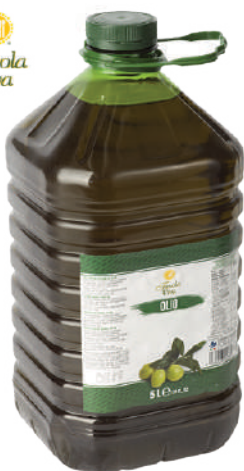
TAVOLA VIVA OLIO EXTRA VERGINE DI OLIVA 17007F - TANICA PET 5L 17007H - TANICA PET 2L 17007G - BOTTIGLIA 1L