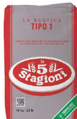
LE 5 STAGIONI FARINA TIPO 1 MACINATA A PIETRA 25KG 33019 - SACCO