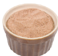
DEMETRA FONDO BRUNO GRANULARE 490G 26000 - BARATTOLO