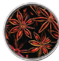
WIBERG ANICE STELLATO INTERO 95G 29025 - SCATOLA