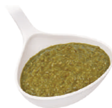
DEMETRA PESTO ALLA GENOVESE 540G 22000 - VASO