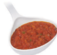
DEMETRA SUGO POMODORELLA 700G 22008A - BUSTA