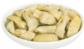
CANNONE CARCIOFI A SPICCHI IN OLIO DI OLIVA 2,5KG 30045 - LATTA