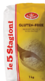
LE 5 STAGIONI GLUTEN FREE 1KG 33010A - SACCHETTO