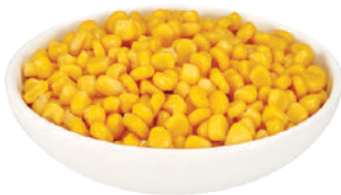
VALFRUTTA GRANCHEF MAIS SUPERSWEET 29109 - LATTA 680G 29110C - LATTA 2,1KG