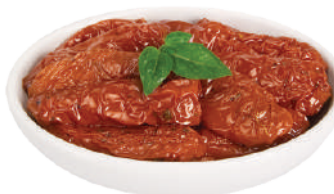
DEMETRA POMODORI SECCHI IN OLIO DI OLIVA 800G 24005X - LATTA