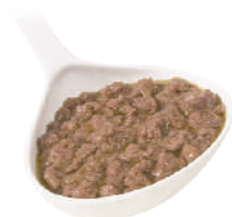
DEMETRA RAGÙ DI CERVO 820G 22003 - LATTA