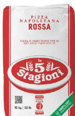
LE 5 STAGIONI FARINA PIZZA NAPOLETANA ROSSA 25KG 33012 - SACCO