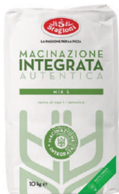
LE 5 STAGIONI FARINA MIA S 10KG 33010B - SACCO