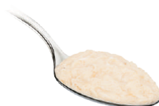
DEMETRA BACCALÀ MANTECATO 540G 28002A - VASO