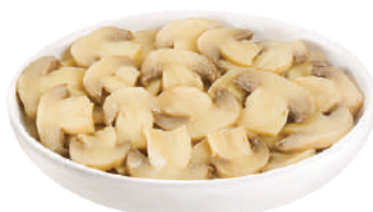
CANNONE FUNGHI TAGLIATI AL NATURALE 2,45KG 30044 - LATTA