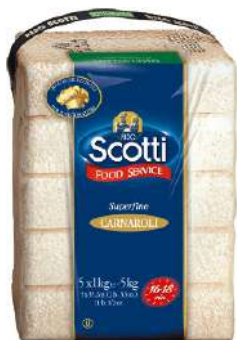
SCOTTI RISO CARNAROLI SUPERFINO FOODSERVICE 1KG 21504C - BUSTA