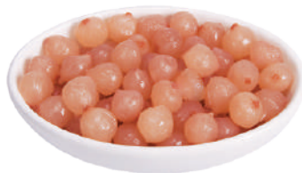
CANNONE LAMPASCIONI ALLA PUGLIESE 2,9KG 23001B - VASO