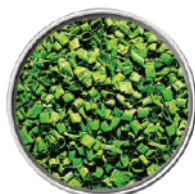
WIBERG ERBA CIPOLLINA LIOFILIZZATA 40G 29024 - SCATOLA