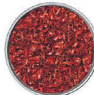
WIBERG ANELLI DI PEPERONCINO PICCANTI 45G 29034B - SCATOLA