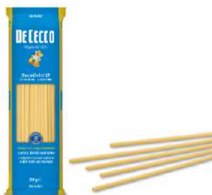
DE CECCO BUCATINI N°15 FOOD SERVICE 1KG 21213 - BUSTA