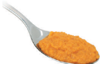
DEMETRA CREMA DI ZUCCA 550G 25014 - VASO