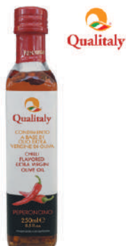
QUALITALY CONDIMENTO A BASE DI OLIO EVO AL PEPERONCINO 250ML 17007P - BOTTIGLIA