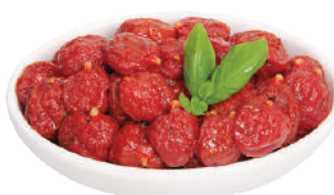
DEMETRA POMODORINI PERLE ROSSE MID-DRY 800G 22013 - LATTA