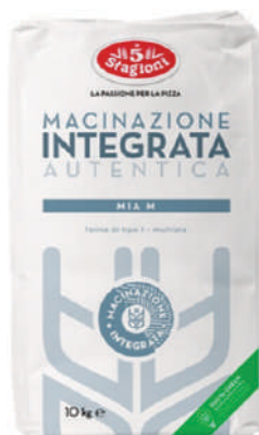
LE 5 STAGIONI FARINA MIA M 10KG 33010C - SACCO