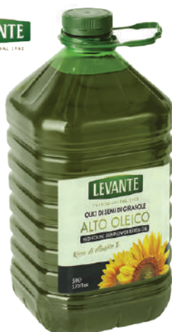
LEVANTE OLIO DI SEMI DI GIRASOLE 17007L - TANICA PET 5L 17007B - BOTTIGLIA PET 1L