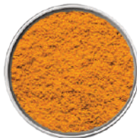
WIBERG CURCUMA MACINATA 280G 29028 - SCATOLA