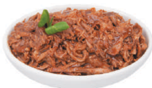
DEMETRA PULLED PORK 1,7KG 22005Z - BUSTA