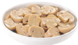
DEMETRA CHAMPIGNONS AFFETTATI 1,7KG 23003 - BUSTA