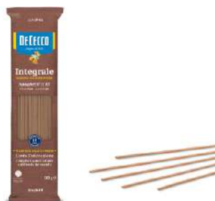
DE CECCO SPAGHETTI N°12 INTEGRALE 500G 21202K - BUSTA