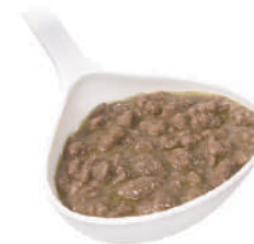
QUALITALY RAGÙ DI CAPRIOLO 820G 22002A - LATTA