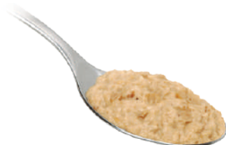
DEMETRA CREMA DI FORMAGGIO AL TARTUFO 550G 28011 - VASO