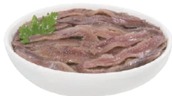
DEMETRA ACCIUGHE A FILETTI IN OLIO DI GIRASOLE 600G 28000A - BAULETTO