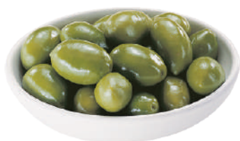
DEMETRA OLIVE VERDI GIGANTI 27026K - VASO 1,6KG 27033 - LATTÀ 2,5KG