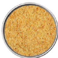
WIBERG BRODO VEGETALE CON SALE ROSA 1,2KG 29008D - SCATOLA