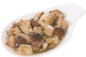
DEMETRA PORCINI TRIFOLATI A PEZZI C'ERA UNA VOLTA 700G 23045 - BUSTA