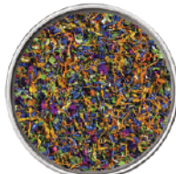
WIBERG MIX DI FIORI-AROMI MISCELA DI FIORI ED ERBE 30G 29079 - SCATOLA