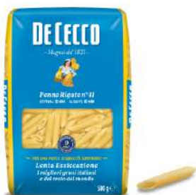
DE CECCO PENNE RIGATE N°41 FOOD SERVICE 1KG 21210 - BUSTA