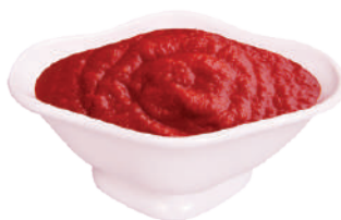
QUALITALY PASSATA DI POMODORO 2,55KG 24002F - LATTA