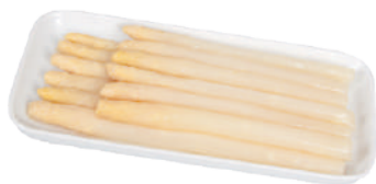
DEMETRA ASPARAGI BIANCHI AL NATURALE 660G 27097 - BAULETTO