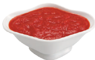
DEMETRA POLPAPIZZA POLPA DI POMODORO FINE 24033 - MINIPACK 2x5KG 24002 - LATTA 2,5KG