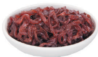
DEMETRA CIPOLLE ROSSE CARAMELLATE 700G 25043B - BUSTA