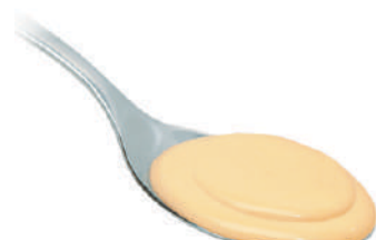
DEMETRA FONDUTA ALLA VALDOSTANA 830G 25026A - VASO