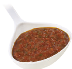
DEMETRA SUGO ALL'ARRABBIATA 830G 22007 - LATTA