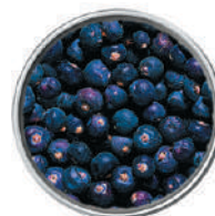
WIBERG BACCHE DI GINEPRO IN GRANI 400G 29026 - SCATOLA