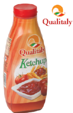
QUALITALY KETCHUP 1070G 30007L - SQUEEZE