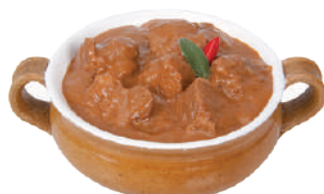
DEMETRA GULASH DEL TRENTINO 850G 28005 - LATTA