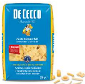
DE CECCO PASTA MISTA N°120 500G 21213A - BUSTA