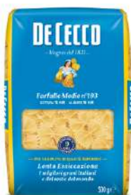
DE CECCO FARFALLE MEDIE N°193 FOOD SERVICE 1KG 21209 - BUSTA