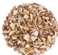
DEMETRA PORCINI SECCHI COMMERCIALI 500G 25033 - VASO PET