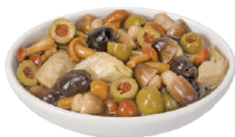
DEMETRA ANTIPASTO JOLLY IN OLIO DI GIRASOLE 1,57KG 27001 - VASO