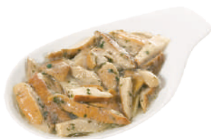
DEMETRA PORCINI TRIFOLATI DEL CAMPESINO 700G 23016 - BUSTA