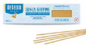
DE CECCO SPAGHETTI N°12 SENZA GLUTINE 400G 21212N - BUSTA