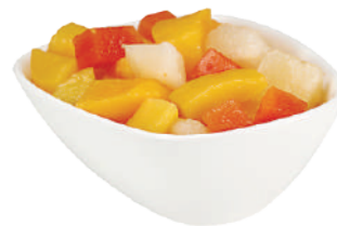
QUALITY MACEDONIA DI FRUTTA ALLO SCIROPPO 2,65KG 24003E - LATTA