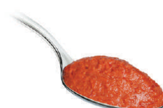
DEMETRA CREMA DI 'NDUJA 530G 27022D - VASO