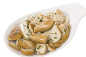
DEMETRA PORCINI TRIFOLATI FARCI PIZZA FETTE E PEZZI 700G 23017 - BUSTA