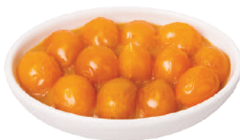
DEMETRA POMODORI DATTERINI GIALLI INTERI 800G 27029A - LATTA