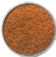
WIBERG NOCE MOSCATA MACINATA 240G 29042 - SCATOLA