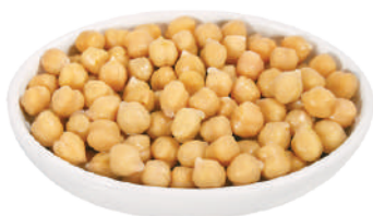
VALFRUTTA GRANCHEF CECI GRANDI 610G 29107 - LATTA