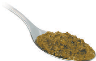
DEMETRA CREMA DI SPINACI 550G 25035 - VASO