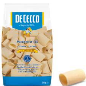
DE CECCO PACCHERI N°125 500G 21201 - BUSTA