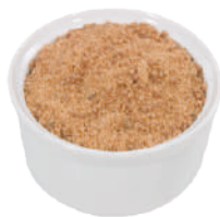
DEMETRA PREPARATO PER BRODO CLASSICO GRANULARE 700G 26002 - BARATTOLO