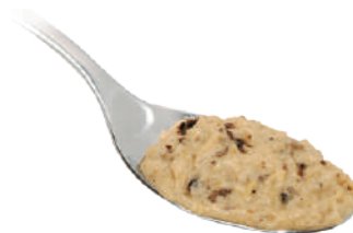
DEMETRA CREMA DI CARCIOFI AL TARTUFO 550G 25003E - VASO