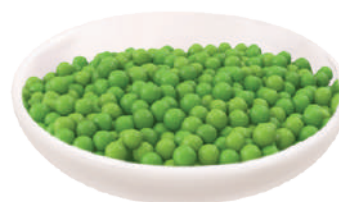
QUALITALY PISELLI MEDI 2,65KG 24003H - LATTÀ