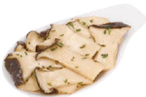
DEMETRA CARDONCELLI TRIFOLATI C'ERA UNA VOLTA 700G 23004P - BUSTA