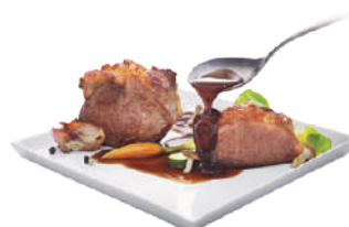
WIBERG FONDO BRUNO PASTOSO 850G 29081 - SQUEEZER