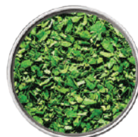
WIBERG MAGGIORANA LIOFILIZZATA 60G 29085 - SCATOLA