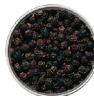
WIBERG PEPE NERO IN GRANI 630G 29043 - SCATOLA