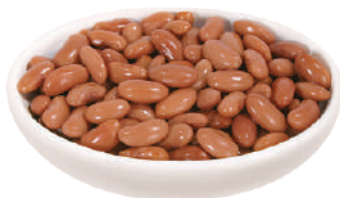
DEMETRA FAGIOLI BORLOTTI LESSATI 2,5KG 27018 - LATTA