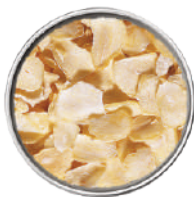
WIBERG AGLIO A FETTE 380G 29072Z - SCATOLA