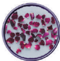
WIBERG PETALI DI ROSA 20G 29113S - SCATOLA