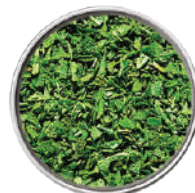
WIBERG SALVIA LIOFILIZZATA 50G 29003 - SCATOLA