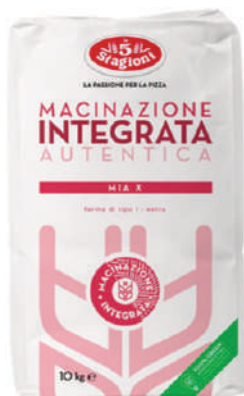
LE 5 STAGIONI FARINA MIA X 10KG 33010D - SACCO