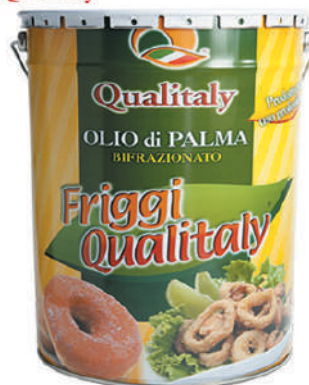
QUALITALY OLIO DI PALMA BIFRAZIONATO 20L 17007K - SECCHIO