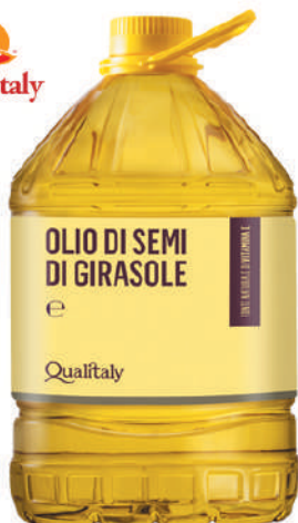
QUALITALY OLIO DI SEMI DI GIRASOLE 17007T - TANICA PET 10L 17007C - TANICA PET 5L