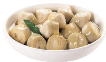
QUALITALY CARCIOFI INTERI 30/40 AL NATURALE 2,5KG 30040 - LATTA