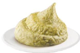
DEMETRA CREM-A-POCHE ASPARAGI VERDI 600G 22012 - SAC-A-POCHE