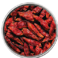
WIBERG PEPERONCINO ROSSO INTERO 100G 29012 - SCATOLA