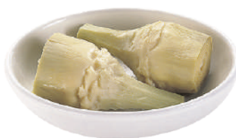
DEMETRA CARCIOFI CON GAMBO 2,5KG 27052A - LATTA