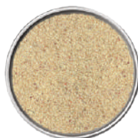
WIBERG BRODO DI MANZO SAPORITO 1,2KG 29113G - SCATOLA