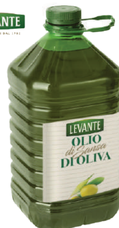
LEVANTE OLIO DI SANSO DI OLIVA 5L 17007O - TANICA PET