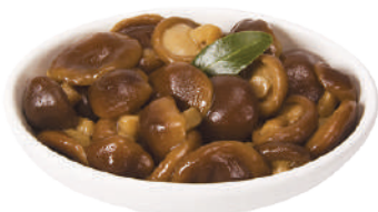
DEMETRA FUNGHI SHII TAKE INTERI IN OLIO DI GIRASOLE 1,6KG 23008 - VASO