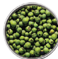
WIBERG PEPE VERDE IN SALAMOIA 170G 29074 - SCATOLA