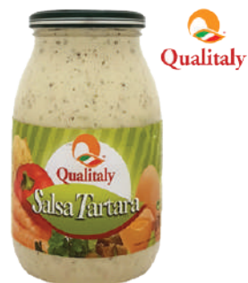
QUALITALY SALSA TARTARA 960G 30010 - VASO