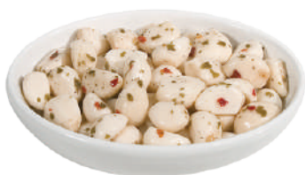
DEMETRA AGLIO DOLCE MARINATO 550G 27000 - VASO