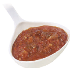
DEMETRA SUGO ALL'AMATRICIANA 830G 22006 - LATTA