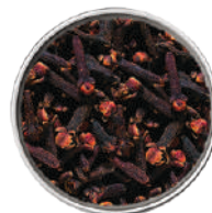
WIBERG CHIODI DI GAROFANO INTERI 200G 29087 - SCATOLA