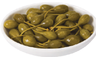
DEMETRA FRUTTI DEL CAPPERO 27022B - VASO 1,6KG 27022L - SCATOLA 780G