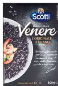
SCOTTI RISO INTEGRALE VENERE PARBOILED 1KG 21504E - PZ