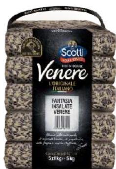
SCOTTI RISO INTEGRALE VENERE FANTASIA INSALATE 1KG 21504F - BUSTA