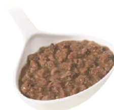
DEMETRA RAGÙ DI CINGHIALE 820G 22004 - LATTA