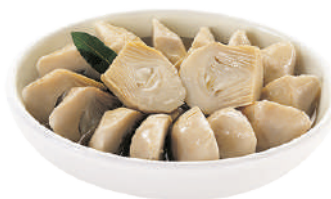
QUALITALY CARCIOFI SPACCATI STIVATI IN OLIO DI GIRASOLE 2,9KG 30037 - VASO