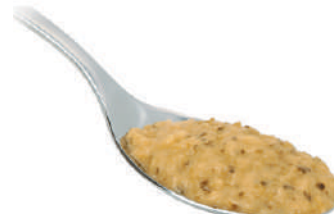
DEMETRA CREMA DI ZUCCHINE 550G 25014A - VASO