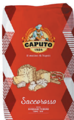
CAPUTO SACCO ROSSO 00 PIZZERIA 25KG 33032G - SACCO