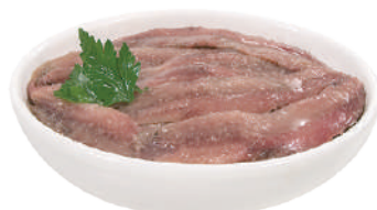
DEMETRA ACCIUGHE A FILETTI SPECIALI DI SICILIA IN OLIO DI OLIVA 700G 28015C - BAULETTO