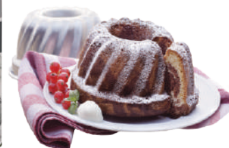
WIBERG OLIO SPRAY SAPORE NEUTRO 500ML 29018 - SPRAY