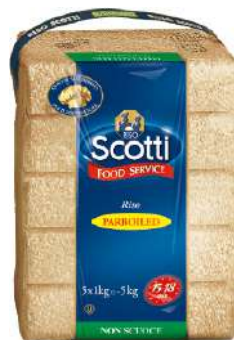
SCOTTI RISO PARBOILED FOODSERVICE 1KG 21504D - BUSTA