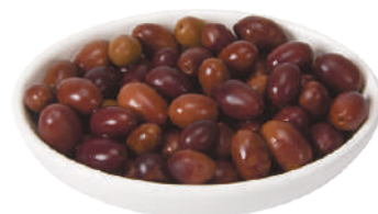
DEMETRA OLIVE TAGGIASCHE 1,6KG 27030 - VASO