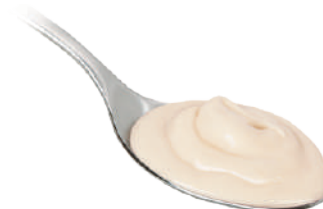
DEMETRA CREMA AL PARMIGIANO REGGIANO 550G 25044 - VASO