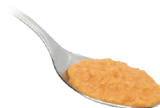
DEMETRA CREMA DI SCAMPI 540G 25012 - VASO