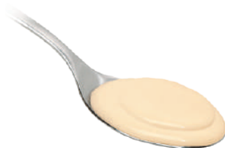
DEMETRA CREMA AI QUATTRO FORMAGGI 25000 - VASO 560G 25026 - LATTA 830G