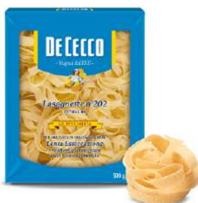
DE CECCO LASAGNETTE N°202 500G 21032A - BUSTA