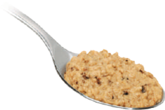
DEMETRA CREMA TARTUFATA CHIARA 540G 25016 - VASO