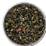
WIBERG MENTA ESSICCATO 70G 29041 - SCATOLA