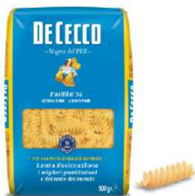
DE CECCO FUSILLI N°34 FOOD SERVICE 1KG 21210A - BUSTA