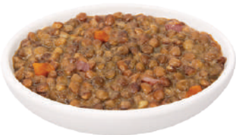
DEMETRA LENTICCHIE IN UMIDO 700G 26005 - BUSTA