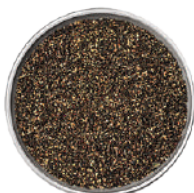
WIBERG PEPE NERO MACINATO GROSSO 520G 29009 - SCATOLA