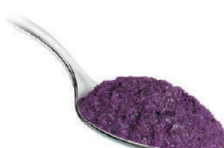
DEMETRA SALSA VIOLA DI CAVOLO CAPPUCCIO 540G 25010B - VASO