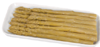
DEMETRA ASPARAGI VERDI AL NATURALE 660G 27003 - BAULETTO