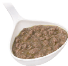
DEMETRA RAGÙ DI CAPRIOLO 820G 22002 - LATTA