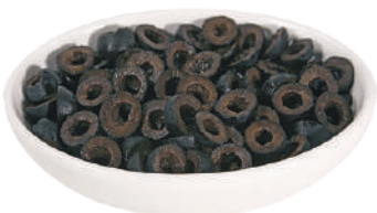
QUALITALY OLIVE NERE A RONDELLE 4KG 30043 - LATTA