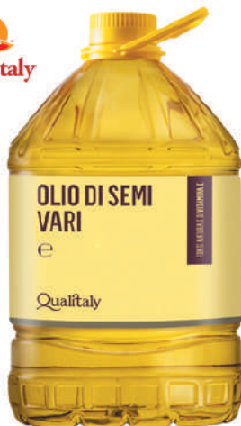
QUALITALY OLIO DI SEMI VARI 17007S - TANICA PET 10L 17007R - TANICA PET 5L