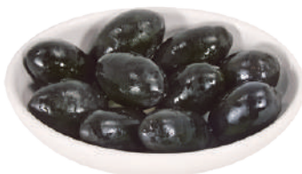
DEMETRA OLIVE NERE GIGANTI 2,5KG 27026 - LATTA