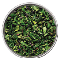
WIBERG TIMO LIOFILIZZATO 75G 29004 - SCATOLA