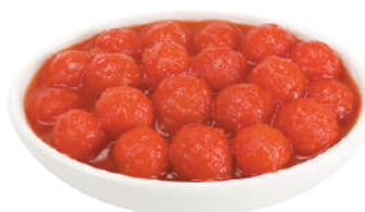
DEMETRA POMODORINI DI COLLINA 800G 24007 - LATTA