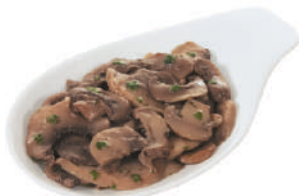
DEMETRA CHAMPIGNONS TRIFOLATI DAL FRESCO SCURI 1,7KG 23007B - BUSTA