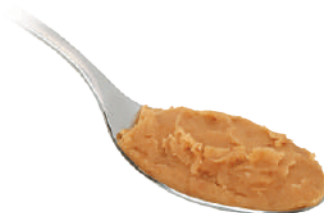
DEMETRA CREMA DI CASTAGNE 600G 27088 - VASO