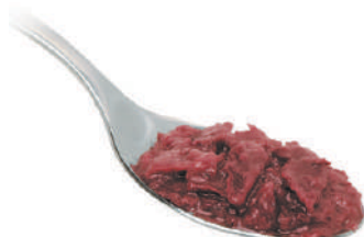
QUALITALY CREMA DI RADICCHIO 580G 30030 - VASO