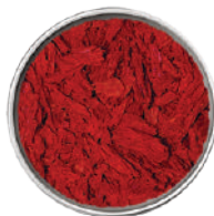
WIBERG FIOCCHI DI POMODORO 170G 29039B - SCATOLA