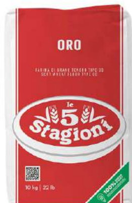
LE 5 STAGIONI FARINA ORO 33008 - SACCO 25KG (ROSSO) 33007C - SACCO 10KG (ROSSO)