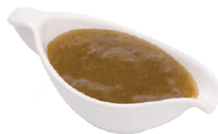
DEMETRA SALSA DI PERE 450G 25019 - VASO