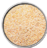
WIBERG AGLIO GRANULARE 800G 29072 - SCATOLA