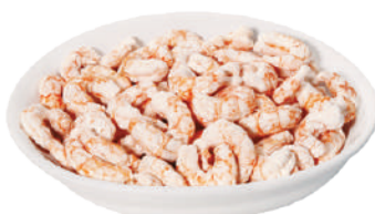
DEMETRA GAMBERETTI DELL'ARTICO LIOFILIZZATI 105G 28001 - SCATOLA