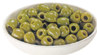
DEMETRA OLIVE VERDI DENOCCIOLATE 2,5KG 27035 - LATTA