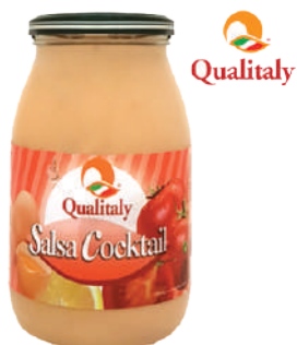
QUALITALY SALSA COCKTAIL 960G 30006 - VASO