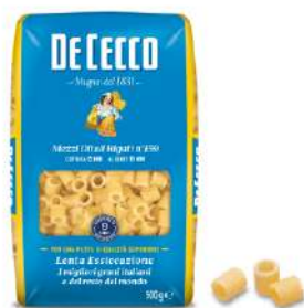
DE CECCO MEZZI DITALI RIGATI N°159 500G 21203 - BUSTA