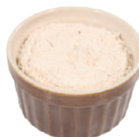
DEMETRA FUMETTO DI PESCE GRANULARE 490G 26001 - BARATTOLO