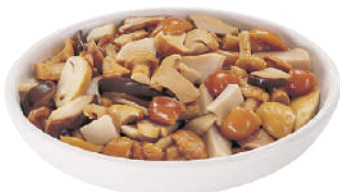
DEMETRA BOUQUET DI FUNGHI 800G 23002 - LATTA