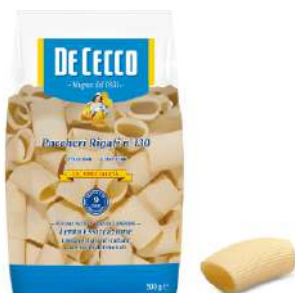
DE CECCO PACCHERI RIGATI N°130 500G 21200 - BUSTA