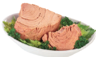
DEMETRA TONNO YELLOWFIN IN OLIO DI OLIVA 28003 - SCATOLA 80Gx3 28003A - TAMBURELLO 515G