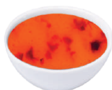
WIBERG SALSA WOK ALL'AGRODOLCE 800G 29113X - SQUEEZER