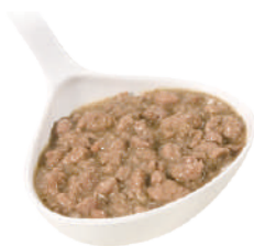
DEMETRA RAGÙ DI ANATRA 820G 22005A - LATTA