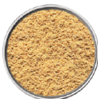
WIBERG ZENZERO MACINATO 180G 290080 - SCATOLA