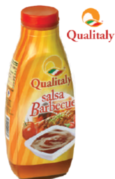
QUALITALY SALSA BARBECUE 900G 30007A - SQUEEZE