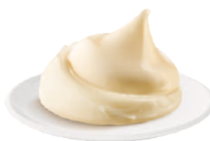
DEMETRA CREM-A-POCHE QUATTRO FORMAGGI 600G 22010 - SAC-A-POCHE