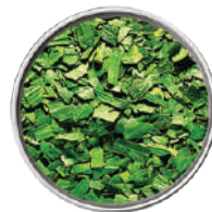
WIBERG DRAGONCELLO LIOFILIZZATO 70G 29036M - SCATOLA