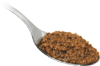
DEMETRA SALSA TARTUFATA TOSCANA 540G 25022 - VASO