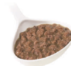
QUALITALY RAGÙ DI CINGHIALE 820G 22000D - LATTA