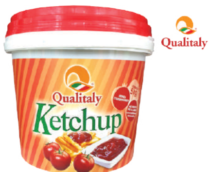
QUALITALY KETCHUP 5KG 3011 - SECCHIO