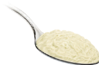
DEMETRA CREMA DI FAVE 550G 23043 - VASO