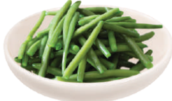
VALFRUTTA GRANCHEF FAGIOLINI FINI 800G 29110A - LATTA