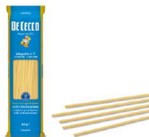
DE CECCO LINGUINE N°7 FOOD SERVICE 1KG 21215 - BUSTA