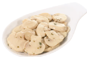
DEMETRA CHAMPIGNONS TRIFOLATI C'ERA UNA VOLTA 1,7KG 23007 - BUSTA