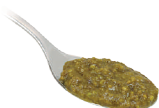
DEMETRA SALSA DI PISTACCHIO 530G 25019A - VASO