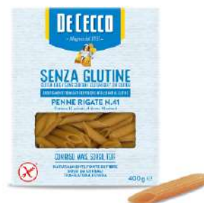
DE CECCO PENNE RIGATE N°41 SENZA GLUTINE 400G 21202H - BUSTA