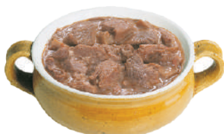
DEMETRA BOCCONCINI DI CINGHIALE ALLA BOSCAIOLA 870G 27073 - LATTA