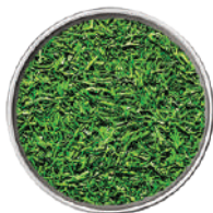
WIBERG ANETO LIOFILIZZATO 80G 29036J - SCATOLA