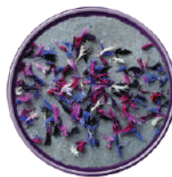
WIBERG MIX COLORATO DI FIORI DELLE ALPI 10G 29039C - SCATOLA