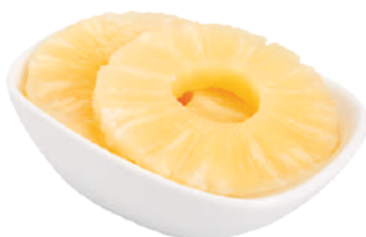
VALFRUTTA GRANCHEF ANANAS A FETTE 836G 29110B - LATTA