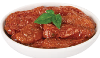
DEMETRA POMODORI SECCHI IN OLIO DI GIRASOLE 1,7KG 24005Z - BUSTA