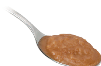
DEMETRA PESTO DI NOCI 530G 27079 - VASO