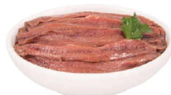
DEMETRA ACCIUGHE A FILETTI DEL MAR CANTABRICO IN OLIO DI OLIVA 725G 28015 - BAULETTO