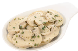
DEMETRA CHAMPIGNONS TRIFOLATI PRIMA SCELTA 1,7KG 23006 - BUSTA