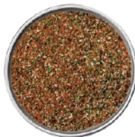
WIBERG GRILL-ARGENTINA STYLE MISCELA DI SPEZIE 550G 29034 - SCATOLA