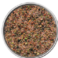
WIBERG MAIALE CROCCANTINO RUSTICO SALE AROMATICO 750G 29034H - SCATOLA